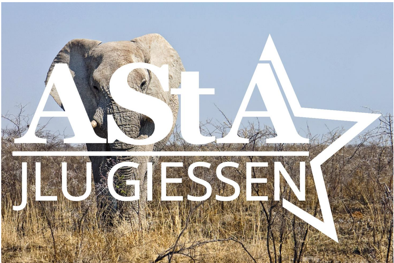
2 AstA JLU Logo weiß final Vorschau