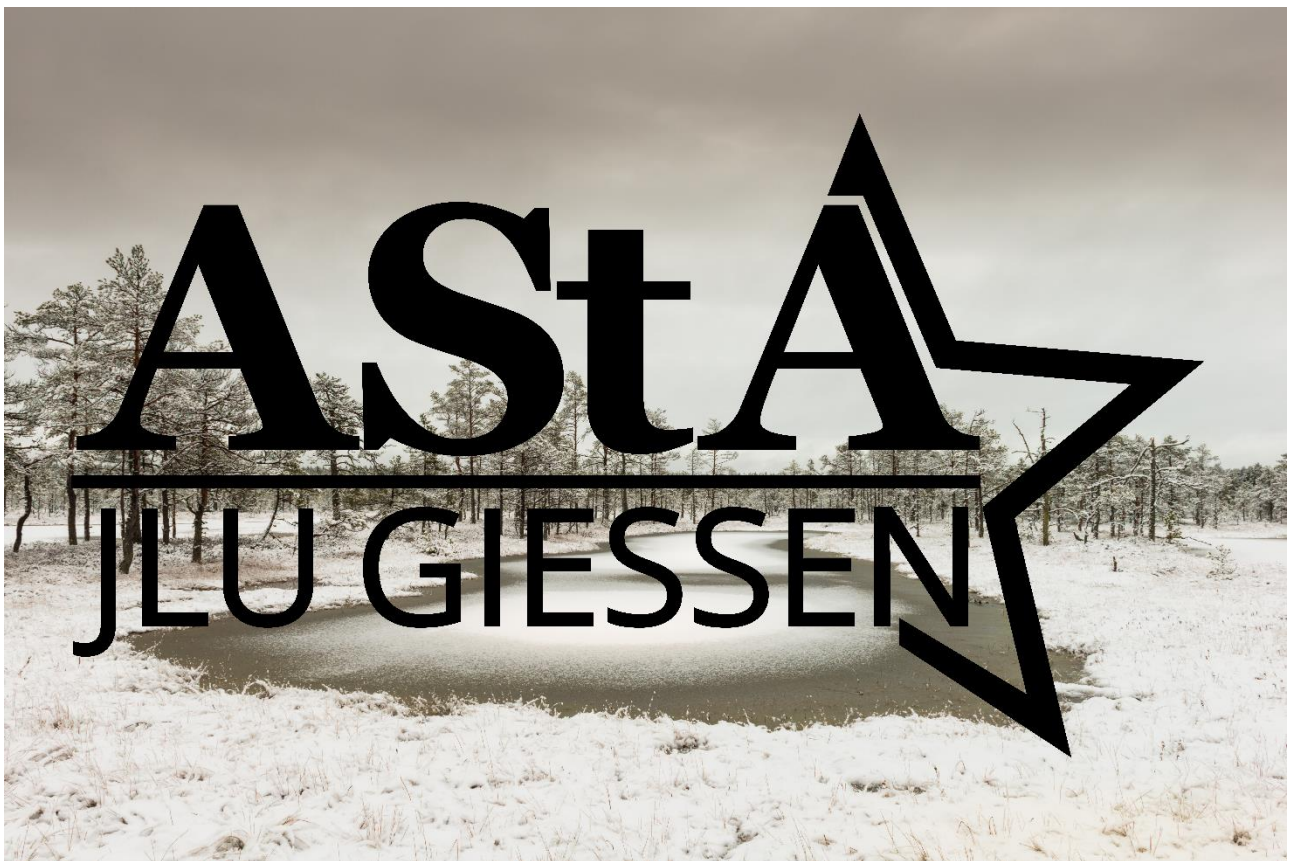
3 AstA JLU Logo schwarz final Vorschau